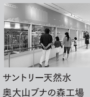
サントリー天然水 奥大山ブナの森工場